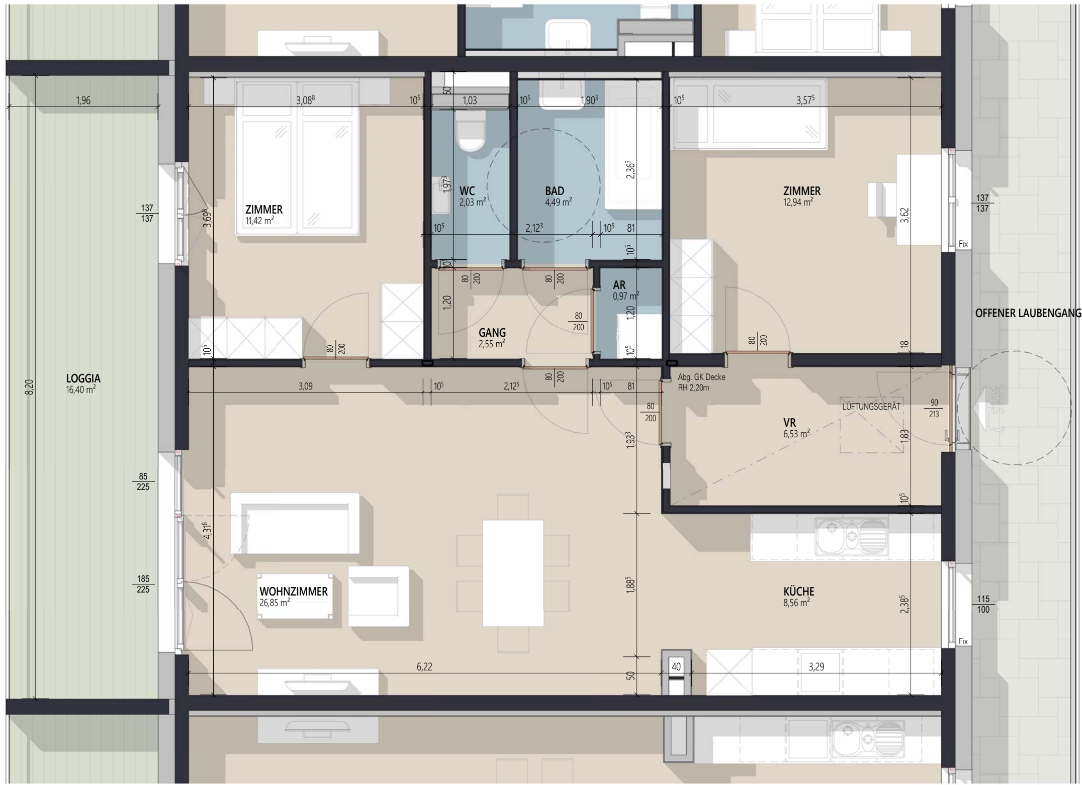
1. Obergeschoss WHS_7 M 1:50