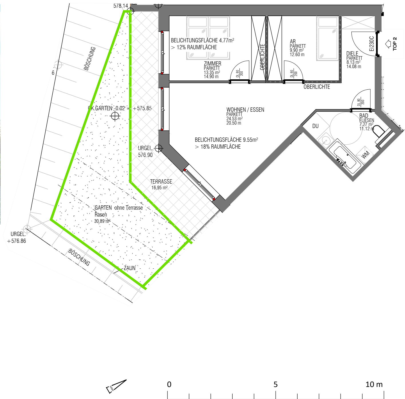
Grundrissausschnitt ERDGESCHOSS TOP 2